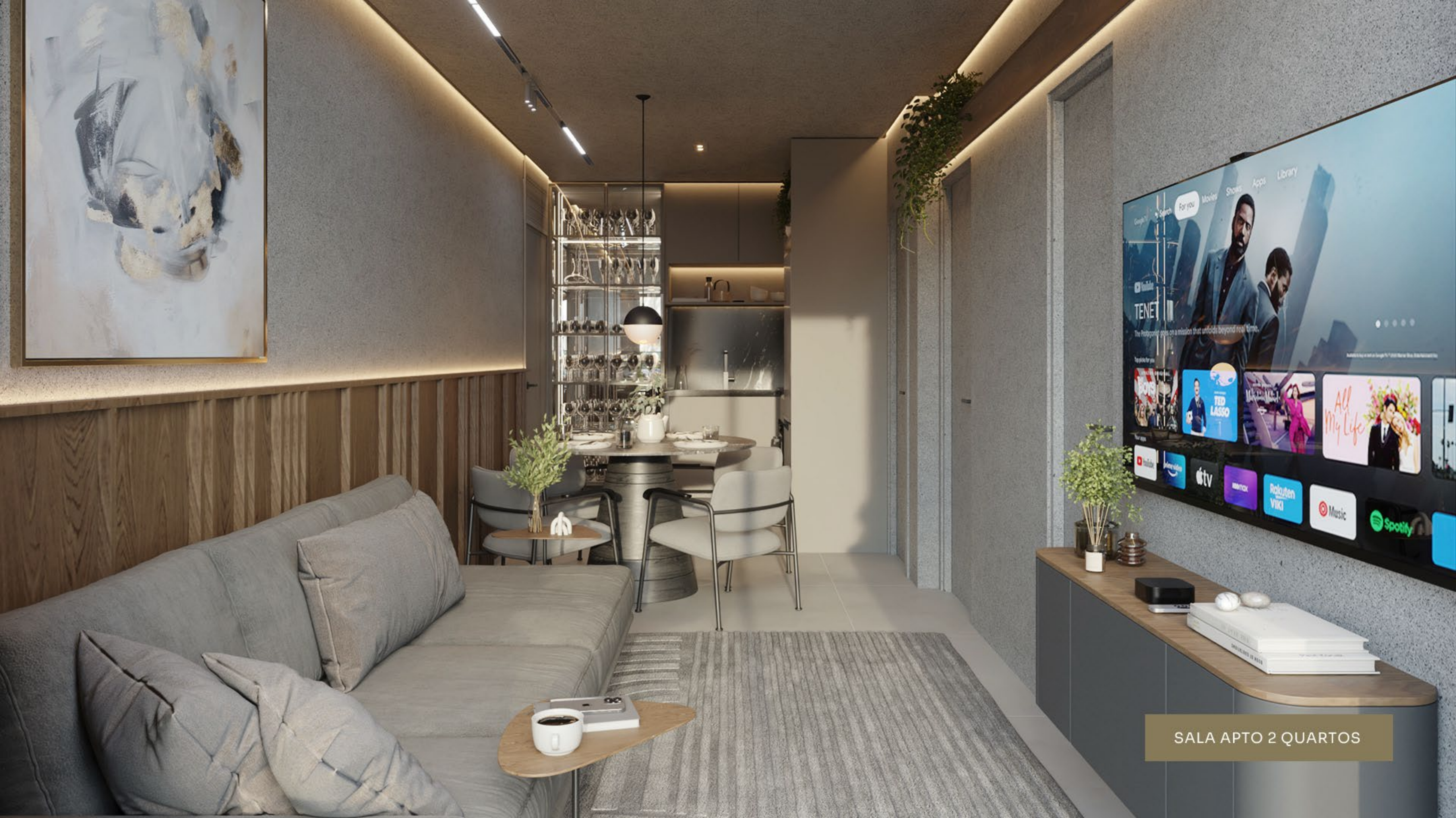
SALA APTO 2 QUARTOS