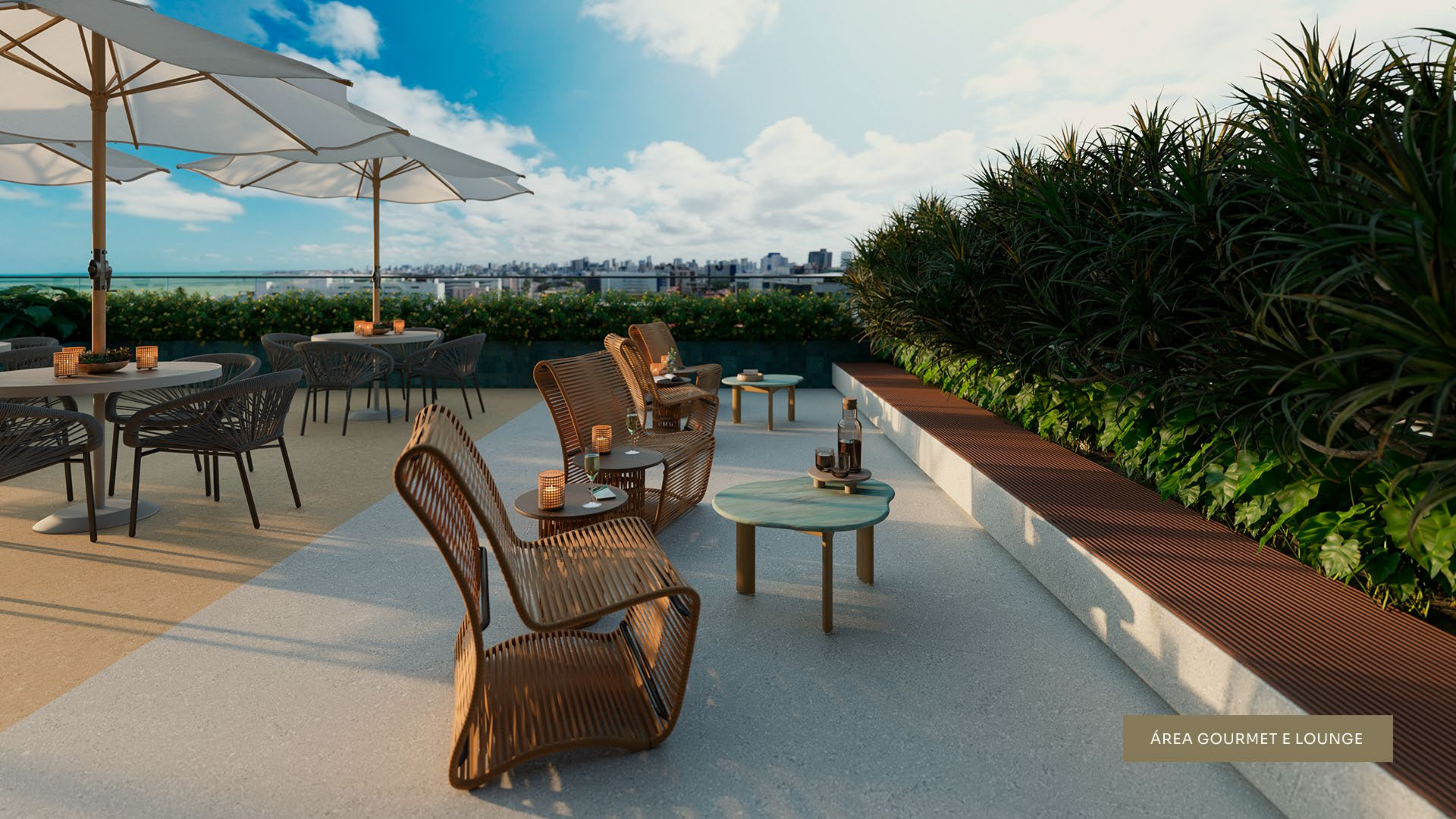
ÁREA GOURMET E LOUNGE