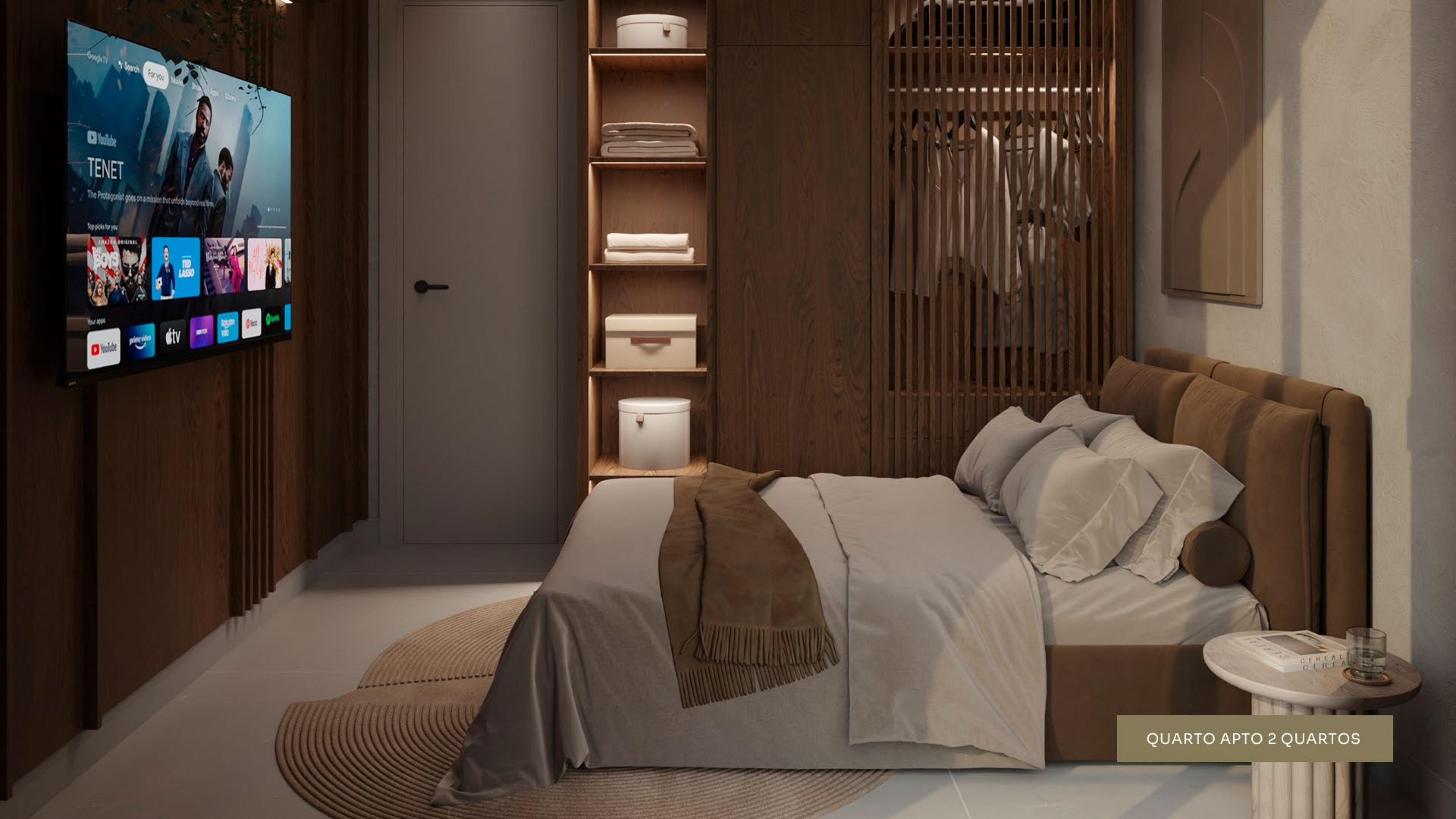
QUARTO APTO 2 QUARTOS